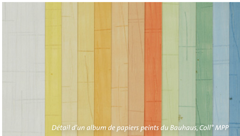
Détail d'un album de papiers peints du Bauhaus, Coll° MPP

17h45 ► Emile Muller (1823-1889), ingénieur alsacien, promoteur de la céramique décorative Jean-François Belhoste, directeur d'études, EPHE